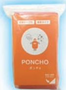
静音アルミポンチョ