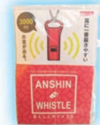
緊急用ホイッスル